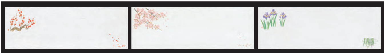
01 (64584) 梅(1月～3月)