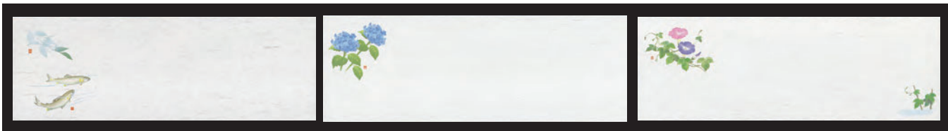
04 (65100) 鮎(4月～8月)