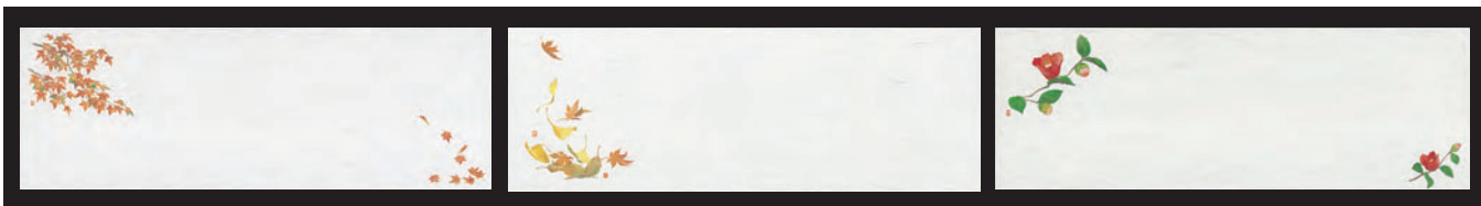
10 (64588) 紅葉(10月～11月)