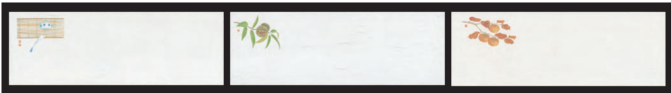
07 (65101) 風鈴(7月～8月)