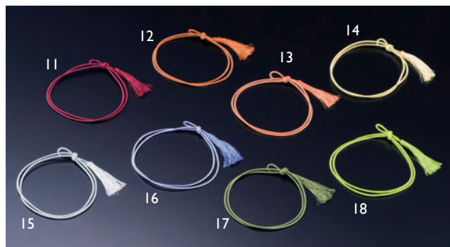
華ゴム房(二重片花結び) (50本入り)