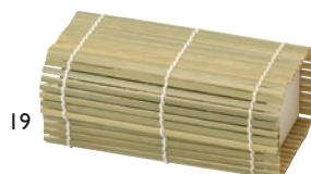
すだれ弁当ミニ 19 (38637) 340円 約14×7.5×H5.5cm 内寸約11×7×H5cm