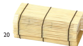
新すだれ弁当 無地ミニ 20 (38636) 320円 約14×8×H6.2cm 内寸約11×7×H5cm ※無地ミニは、ガーゼは貼っておりません。