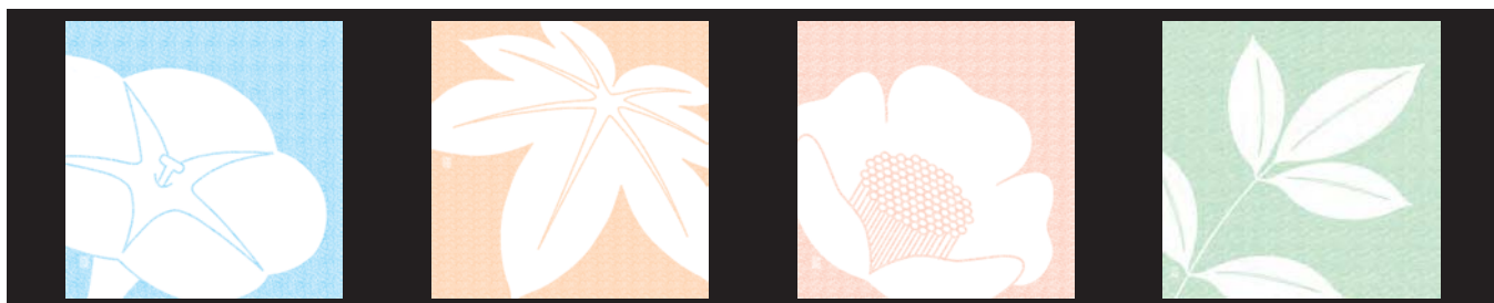
04 (66734) あさがお(7月～8月)