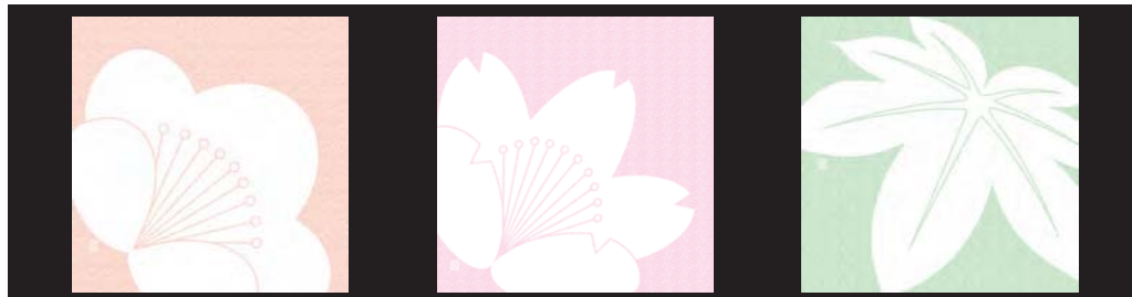
01 (66731) うめ(1月～3月)

大胆に季節を切り取りました。表面と裏面での色の濃淡をお楽しみください。 両面共に抗菌効果があります。