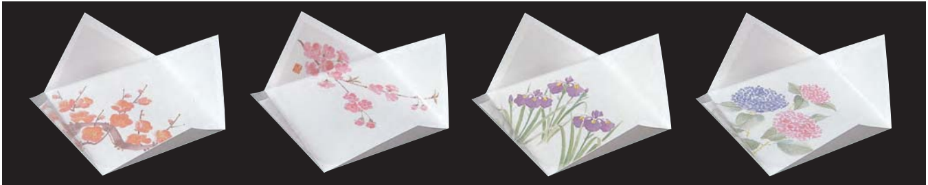
01 (65590) うめ(1月~3月) 02 (65591) さくら(3月~4月) 03 (65592) あやめ(4月~5月) 04 (65593) あじさい(6月~7月)