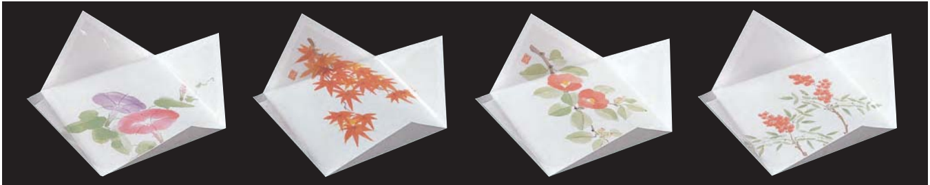
05 (65594) あさがお(7月~8月) 06 (65595) もみじ(9月~11月) 07 (65596) つばき(11月~2月) 08 (65597) なんてん(12月~1月)