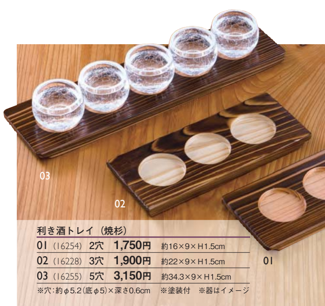
利き酒トレイ (焼杉)