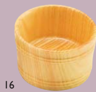
ひのき珍味入 浅型