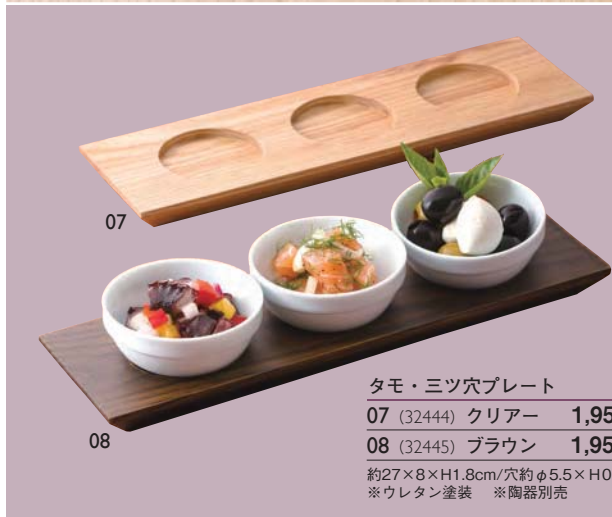
タモ・三ツ穴プレート