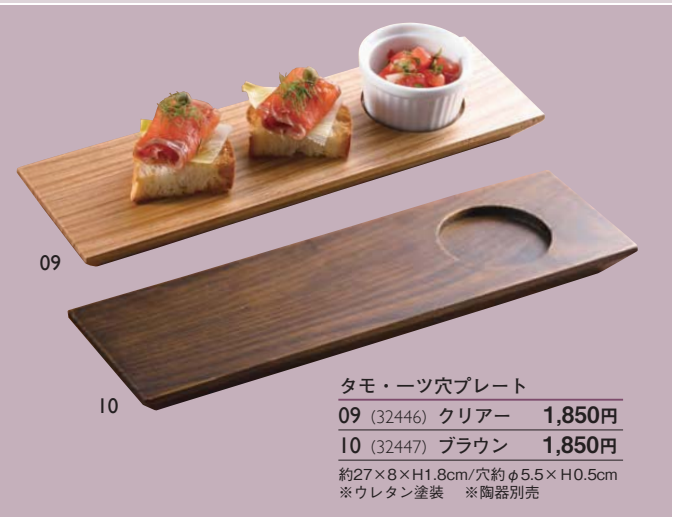
タモ・一ツ穴プレート

約27×8×H1.8cm/穴約φ5.5×H0.5cm ※ウレタン塗装 ※陶器別売