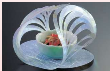
オーロラマリモ (100枚入)

13 (26128) 小 8,400円 約9.3×7.2×H6.5cm (1枚当り84円) 14 (26127) 大 11,500円 約12.5×10×H8cm (1枚当り115円) ※お料理を直接盛り付ける際は、光沢のある面をご使用ください。