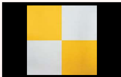
市松懐敷 金銀 (200枚入)

03 (25266) 3寸 2,100円 約9×9cm (1枚当り10.5円) 04 (25267) 4寸 3,000円 約12×12cm (1枚当り15円) 05 (25268) 5寸 4,000円 約15×15cm (1枚当り20円)