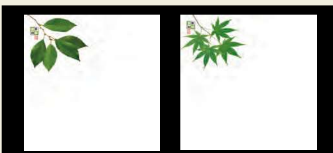
17 (66782) 桜

■ 抗菌加工製品の抗菌効果は、「JIS Z 2801」において抗菌活性値が2.0以上とすると定められています。