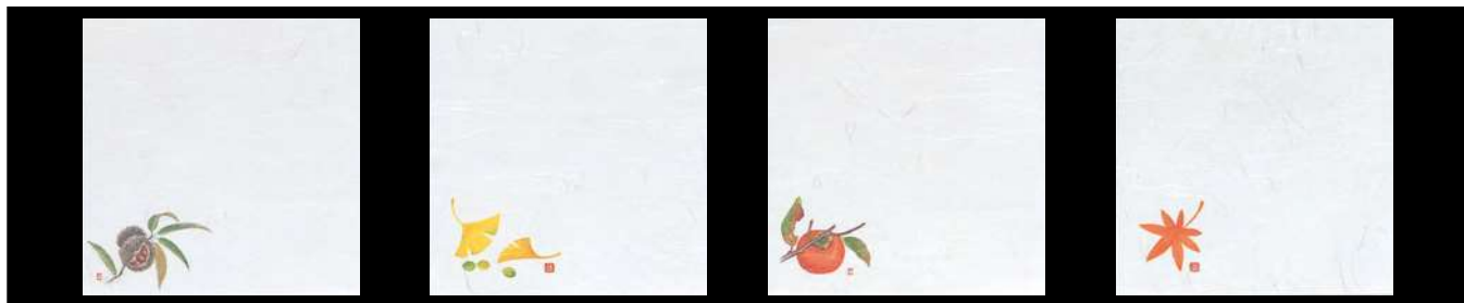
05 (65001) くり(8月~10月)