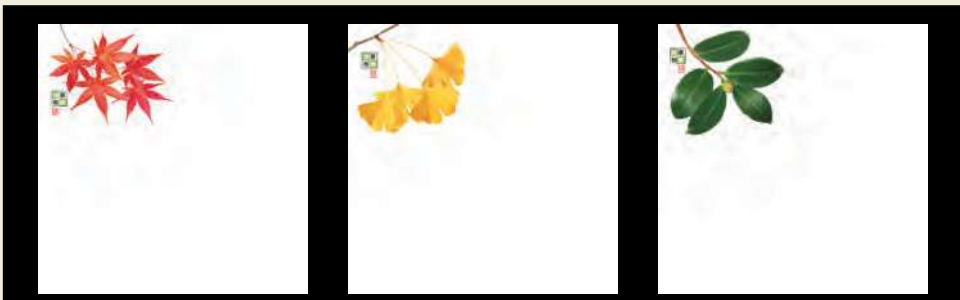
19 (66784) 赤もみじ