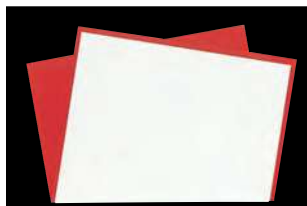
05 (64306) 赤