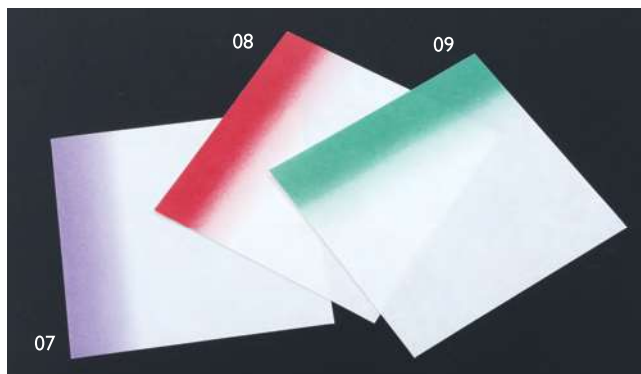
07 (63871) 紫