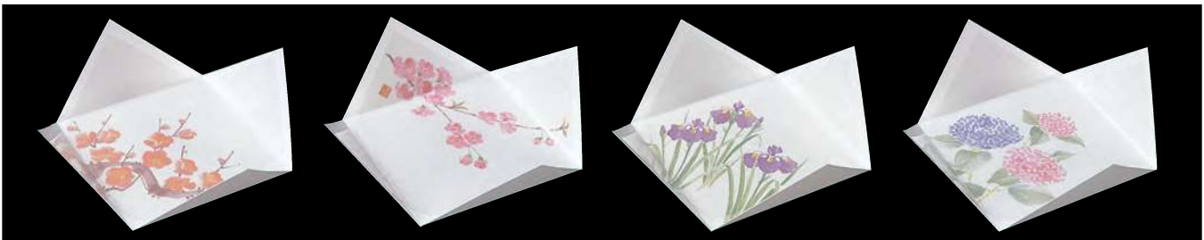
01 (65590) うめ(1月~3月) 02 (65591) さくら(3月~4月) 03 (65592) あやめ(4月~5月) 04 (65593) あじさい(6月~7月)