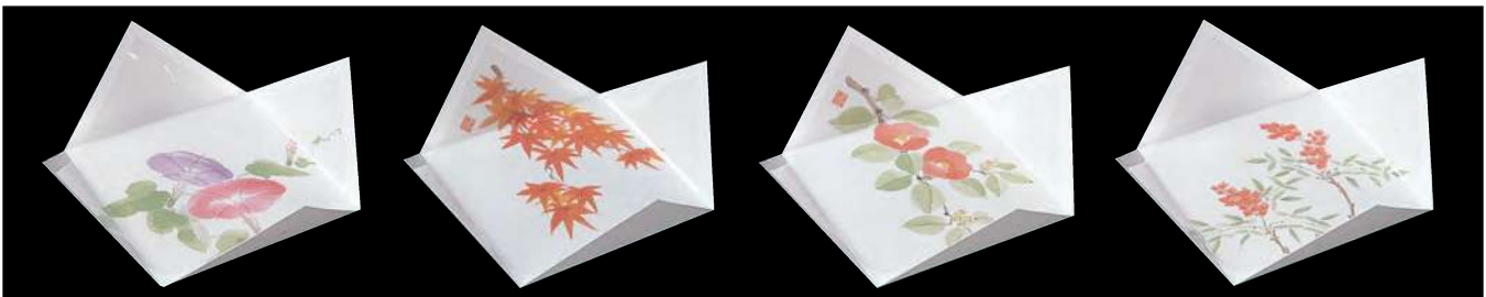
05 (65594) あさがお(7月~8月) 06 (65595) もみじ(9月~11月) 07 (65596) つばき(11月~2月) 08 (65597) なんてん(12月~1月)