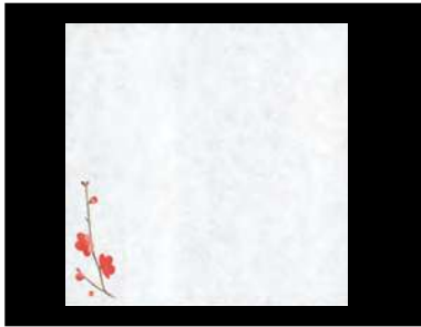
01 (64914) 梅(1月～3月)