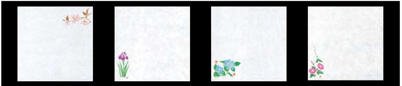
02 (64915) 桜(3月～4月)