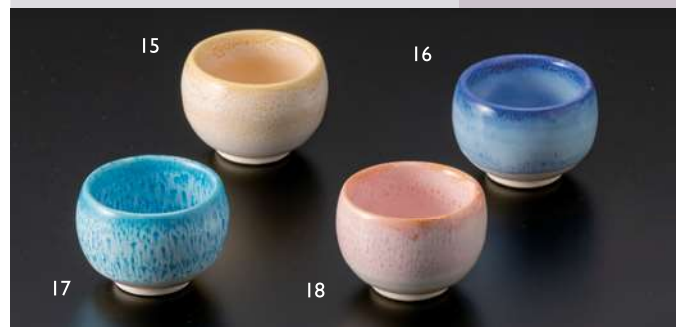
二色吹き丸型珍味入 15 (26285) 黄 280円 16 (26289) ルリ 280円 17 (26288) 水色 280円 18 (26286) ピンク 280円 約φ5.5×H4cm