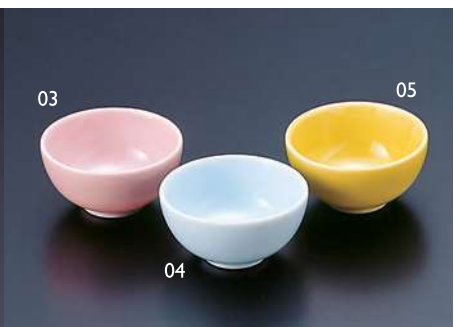
色釉丸型珍味入 03 (25640) ピンク 310円 04 (25641) ブルー 310円 05 (25642) イエロー 310円 約φ5.5×H2.5cm