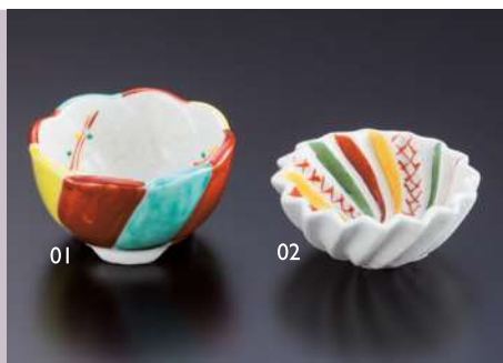
十草三ツ足珍味入 01 (26107) 710円 約φ7×H3.8cm 彩り菊型珍味入 02 (26108) 880円 約φ7×H2.8cm