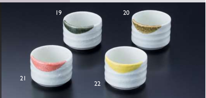
粉引釉珍味入 19 (26894) 織部 220円 20 (26895) アメ釉 220円 21 (26896) 朱 220円 22 (26897) 黄 220円 約φ5.4×H4cm