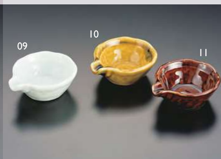
片口小付 09 (29010) ゆず青磁 670円 10 (29011) 黄瀬戸織部掛 670円 11 (29012) 飴釉 670円 約7.5×6.5×H2.8cm