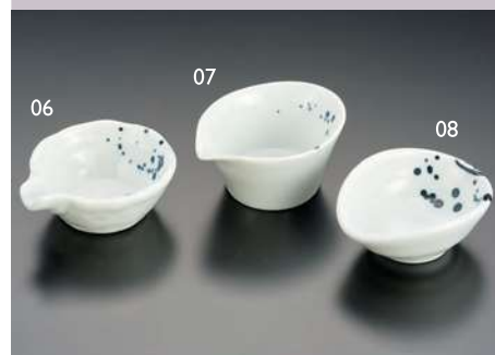
染付白 06 (29013) 片口小付 670円 約7.5×6.5×H2.8cm 07 (29015) 7カット片口小付 670円 約7.6×6×H3.5cm 08 (29014) 小判小付 670円 約7.5×6×H3cm