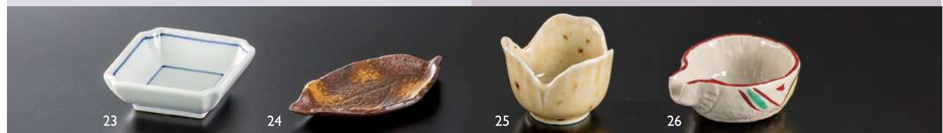
角小皿 細筋 23 (26567) 920円 約7×7×H2.5cm 備前木の葉皿 24 (25576) 600円 約10×6×H1cm 三ツ山珍味小付 25 (29009) 520円 約φ6×H4.5cm 色彩片口珍味入 26 (25033) 780円 約7.3×6.5×H3cm