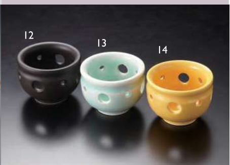
陶器・花の和珍味入 12 (26717) 黒 580円 13 (26718) 青磁 580円 14 (26716) 黄 580円 約φ5.5×H4cm