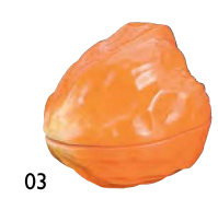
新鬼灯(ほおずき)珍味入 03 (27683) 3,100円 約4.3×5.6×H4.8cm ※内側の色：白