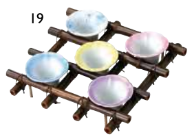
新朝顔柵(黒竹)足付 19 (24231) 2,900円 約21×21×H6.5cm ※陶器別売