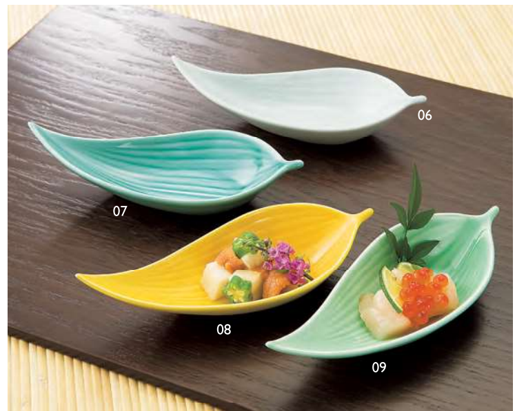
笹型小鉢 06 (26562) 青磁 1,300円 07 (32247) グリーン 1,300円 08 (26563) イエロー 1,300円 09 (26561) 萌黄 1,300円 約15.3×6.2×H3.3cm

強化磁器 通常使用されている並土生地よりもさらに強度を上げるために開発された生地(土のこと)を使用し、通常の焼窯よりも高温に設定することで得られる磁器です。