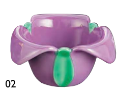
あやめ珍味入 02 (25582) 2,300円 約φ7.5×H3.5cm