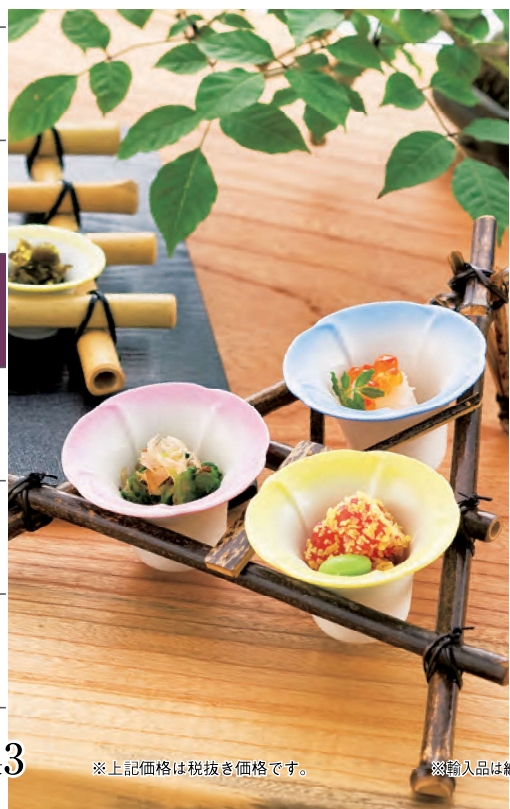
竹フォークのみ 13 (08565) 280円 約L12.5×1cm ※うちわ皿専用部品(3色共通)