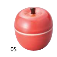
りんご珍味入 05 (27758) 660円 約φ5.2×H5.8cm ※内側の色：赤 ※輸入陶器(小箱10ヶ入)