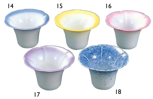
朝顔珍味入 14 (25460) 青 890円 15 (25463) 黄 890円 16 (25461) ピンク 890円 17 (25462) 紫 890円 18 (25464) 吹墨 890円 約φ6.3×H4.5cm