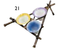
黒竹三角朝顔柵 21 (24107) 2,900円 約20×23×H9cm ※陶器別売