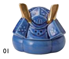
かぶと珍味入 藍 01 (25403) 1,500円 約6.5×6.5×H6cm ※内側の色：白 ※輸入陶器(小箱1ヶ入)