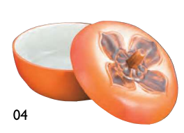
新柿型珍味入 04 (27676) 630円 約φ6.3×H4.5cm ※内側の色：白 ※輸入陶器(小箱10ヶ入)