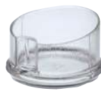
樹脂カップ プチワイン 03 (32473) 55円 約φ5.5×H4.5cm ※PS(ポリスチレン)