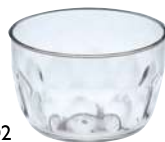
樹脂カップ クリスタル 01 (32471) 95円 約φ5.9×H3.6cm ※PS(ポリスチレン)