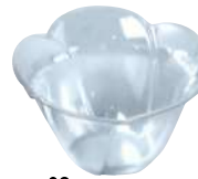
08 (27806) 黒 4,700円 (1ヶ当り23.5円) ※材質:HIPS ※耐熱温度 +60~0℃