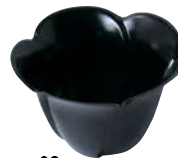
ワンウェイ・プラ小鉢 梅(200個入) 07 (27805) 金 7,500円 (1ヶ当り37.5円) ※材質:耐熱HIPS ※耐熱温度 +80~-20℃