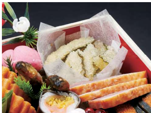
両面OP珍味入(200枚入) 約7×7×H5.5cm 12 (66392) 白雲竜(小) 8,000円 (1ヶ当り40円) 13 (66395) 紅梅雲竜(小) 8,000円 (1ヶ当り40円) 14 (66398) 双金(小) 9,000円 (1ヶ当り45円)