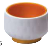
樹脂カップ 竹チョコ 04 (32474) 45円 約φ4.8×H3(2.4)cm ※PS(ポリスチレン)