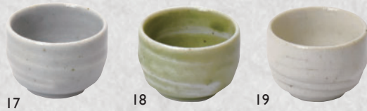
平型渦珍味入 17 (27834) 水色 290円 18 (27835) 緑 290円 19 (27833) 白 290円 約φ5.7×H4cm ※国産品