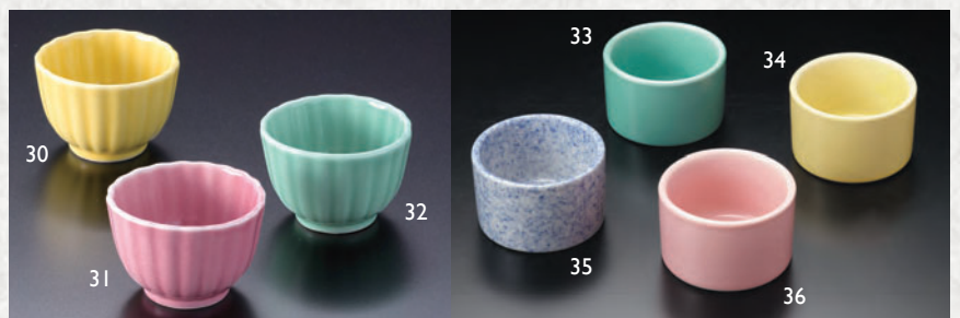
菊珍味入 30 (26594) イエロー 200円 31 (26499) ピンク 200円 32 (26593) グリーン 200円 約φ4.8×H3.5cm ※輸入陶器 (小箱10ヶ入)