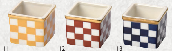
手描き金縁市松珍味入 550円 11 (27686) 黄 12 (26739) 朱 13 (26731) 藍 約5×5×H4.1cm ※輸入陶器 (小箱10個入)