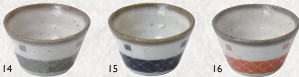
彩帯珍味入 14 (27843) 緑 290円 15 (27844) 藍 290円 16 (27845) 朱 290円 約φ7.2×H4.2cm ※国産品