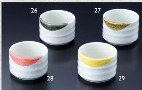
粉引釉珍味入 26 (26894) 織部 190円 27 (26895) アメ釉 190円 28 (26896) 朱 190円 29 (26897) 黄 190円 約φ5.4×H4cm ※国産品