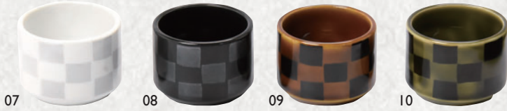
市松丸珍味入 07 (27706) 白 190円 08 (27707) 黒 190円 09 (27708) 飴釉 190円 10 (27709) 織部 190円 約φ5.5×H3.8cm ※国産品