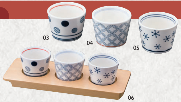
小ちよこ 03 (26961) 丸紋 250円 04 (26962) 七宝つなぎ 250円 05 (26963) 雪花 250円 約φ5.6×H4.2cm ※輸入陶器 (小箱20ヶ入)