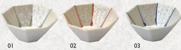
八角ラスター珍味入 01 (27836) ヒワ 800円 02 (27837) ピンク 800円 03 (27838) ルリ 800円 約8×8×H3.4cm