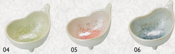
ナス型ラスター珍味入 04 (27918) ヒワ 850円 05 (27917) ピンク 850円 06 (27919) ルリ 850円 約6.2×8.2×H4.9cm ※三ツ足付