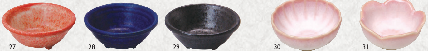
三ツ足小鉢 27 (27896) 紅梅 320円 約φ9×H3.7cm 28 (27897) ルリ紺 320円 約φ9×H3.7cm 29 (27898) 黒結晶 320円 約φ9×H3.7cm