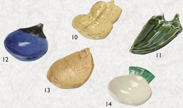
京野菜小皿 10 (27865) 鹿ヶ谷南瓜 3,250円 約8×6×H2cm 11 (27866) 伏見唐辛子 3,250円 約10×5×H2cm 12 (27867) 賀茂茄子 3,250円 約7.7×6.3×H2cm 13 (27868) 京筍 3,250円 約9×5.6×H2cm 14 (27869) 聖護院蕪 3,250円 約8×6.5×H2cm