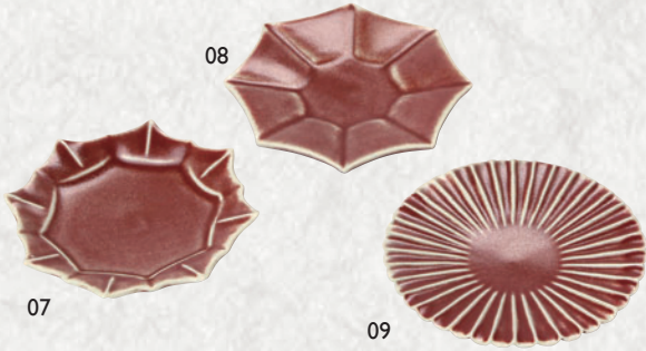
京陶器・朱泥小皿 07 (27872) 凌花 3,250円 約φ9.1×H1.5cm 08 (27871) 八角 3,250円 約φ9.1×H1.2cm 09 (27870) 輪花 3,250円 約φ9.1×H1.2cm