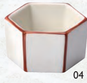
縁赤六角珍味入 04 (27648) 270円 約5.8×5×H3cm ※輸入陶器(小箱10ヶ入)