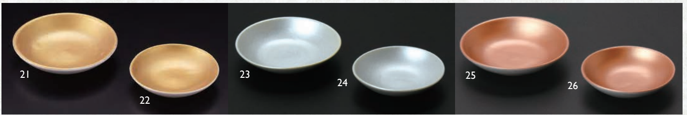
内金平盃 ※裏側: 白色 21 (19326) 3寸 1,350円 約φ9.5×H2.2cm 22 (19327) 2.5寸 1,100円 約φ7.5×H1.5cm