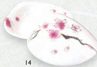
強化磁器 錦桜画貝型珍味 14 (26916) 1,850円 約7.7×6.7×H3.7cm ※国産品