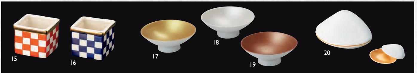
手描き金縁市松珍味入 15 (26739) 朱 600円 16 (26731) 藍 600円 約5×5×H4.1cm ※輸入陶器(小箱10個入)