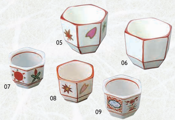
陶器・ぼんぼり(中) 05 (26448) 春秋 380円 06 (26449) 無地 300円 約φ5.7×H4.7cm ※輸入陶器(小箱10ヶ入)