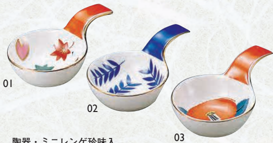
陶器・ミニレンゲ珍味入 01 (26608) 春秋 330円 02 (26609) 草紋 330円 03 (26607) 椿 330円