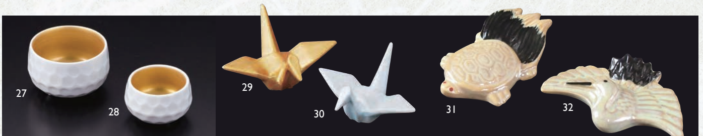
内金彩三ツ足小付 27 (26923) 大 1,300円 約φ5.7×H3.7cm 28 (26924) 小 1,200円 約φ4.7×H3cm