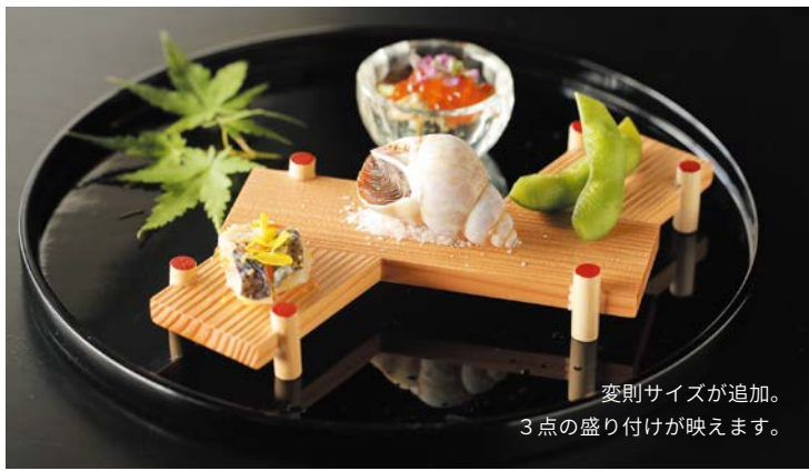
変則サイズが追加。 3点の盛り付けが映えます。