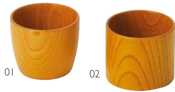
樺・ぐいのみ型小鉢 01 (12020) 椀型 2,700円 約φ6×H5cm 02 (12021) 切立 2,700円 約φ6×H5cm