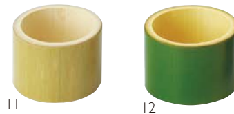
丸竹輪切り 11 (22248) 無塗装 120円 12 (25729) 青塗 750円 ※ウレタン塗装付 約φ5.2~5.9×H4cm