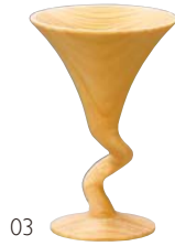
ひのき くねくねグラス 03 (12116) 8,900円 約φ6.9×H10cm ※容量: 満約25ml ※ウレタン塗装付