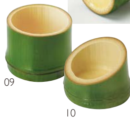
青塗丸竹珍味入 09 (22204) フラット 820円 約φ5.5~6×H4.5cm 10 (22205) ハス切り 820円 約φ5.5~6×H4.5(2.5)cm ※ウレタン塗装付