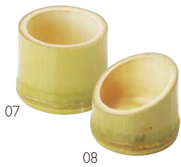
丸竹千代口(無塗装) 07 (25740) 240円 約φ6×H4.5cm ハス切り竹千代口(無塗装) 08 (25741) 240円 約φ6×H4.5(2.5)cm