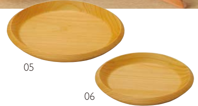
桧丸皿 積重 05 (32568) 大 1,750円 約φ14.5×H1.5cm/内底約φ11.5cm 06 (32569) 小 1,350円 約φ12×H1.5cm/内底約φ9cm ※硝子ミディドーム別売 P04 参照▶