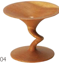
すぎ くねくねグラス(浅型大) 04 (12132) 9,000円 約φ9×H7.5cm ※ウレタン塗装付