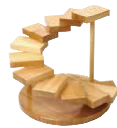
(781911) 彩り 螺旋 35,000円

サイズ：約φ39.5×H32.3 cm / ベース：約φ35×H2.2 cm 段板：約12×7.8×H2.5 cm / 重さ：約2.5kg / 材質：木製 生産国：日本 / 塗装：ウレタン