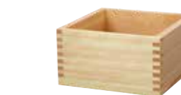
(781935) 彩り ひのき一升枧 2,350円

材質：木製品 / 生産国：ベトナム / 塗装：ウレタン パッケージ：PP袋入 ※裏面は黒 (リバーシブル)