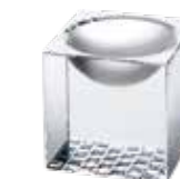
(781713) 彩り クリスタルクューブ 4,850円

サイズ：約φ7.8×H3 cm (内高2.4 cm) 容量：満約25 ml / 重さ：約67g / 材質：陶磁器 生産国：中国 / パッケージ：PP袋入