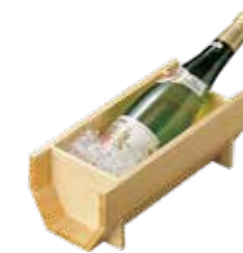
(781928) 彩り 冷酒クーラー 7,750円

サイズ：約22.5×12×H10 cm (内寸約15×9.5〔底5.5〕×H8.5 cm) 重さ：約430g / 材質：木製品 / 生産国：日本 / 塗装：ウレタン パッケージ：箱入 (総重量：約580g)