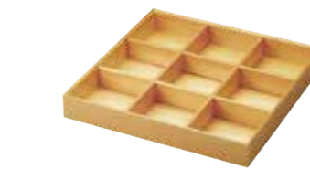
(781980) 彩り 九つ仕切り弁当 6,600円

サイズ：約φ5.9×H4.1 cm / 容量：満約50 ml / 重さ：約30g 材質：陶磁器 / 生産国：中国 / パッケージ：PP袋入