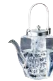
(780303) 彩り チロリ 23,880円

サイズ：約31×31×H4.8 cm (内寸約29.5×29.5×H4 cm) (1 樹内寸約9.3×9.3 cm / 仕切約H3.5 cm) ※身・仕切セット※9.2 cm以下の中子をお選びください。 重さ：約670g / 材質：木製品 / 生産国：中国 塗装：ウレタン / パッケージ：箱入