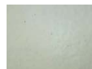
ラビットホワイト XS-16