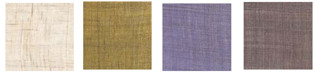
No.1 生成 No.2 鶯色 No.3 花田色 No.4 燦竹