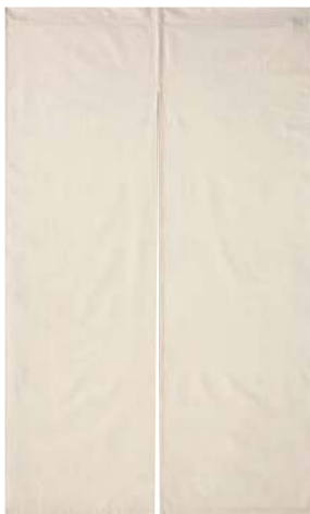
生成のれん ※生地:綿(ブッチャー) 05 (56814) 約90×150cm