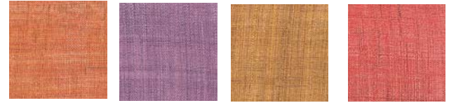
No.5 薄柿 No.6 紅藤 No.7 桑茶 No.8 珊瑚