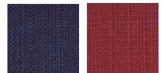
No.1 紺 No.2 えんじ