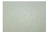
ラビットホワイト XS-16