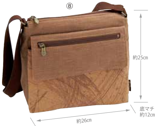
⑧864850 柿渋染 やまぼうし 8,400円(税抜) (KS-177T) 約26×H25×底マチ12cm・(調整可ショルダー)約63~120cm 重さ約320g/ファスナー開閉 材質:(本体)綿・(ショルダー)アクリル・(金具)スチール 外側:ファスナーポケット1・マグネット開閉ファスナーポケット1 背面マグネット開閉ポケット1 内側:オープンポケット1・携帯ポケット1