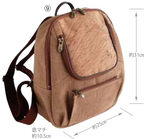
⑨869688 柿渋染 NEWリュック 13,000円(税抜) (KS-169TW) 約25×H31(持ち手立ち上がりH5)×底マチ10.5cm (調整可ショルダー)約55~105cm/重さ約430g/ファスナー開閉 材質:(本体前面)綿・(本体背面)メッシュ・(ショルダー)アクリル (金具)スチール/外側:(前面上部・下部)ファスナーポケット各1 (背面)マジックテープ式オープンポケット1 内側:(本体)ファスナーポケット1・(前面上部)ファスナーポケット1