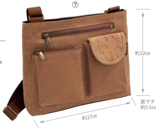
⑦851270 柿渋染 手描きWアウトポケットショルダー 6,300円(税抜) (KS-161T) 約27×H22×底マチ5.5cm・(調整可ショルダー)約65~118cm 重さ約280g/ファスナー開閉 材質:(本体)綿・(本体開口部)合皮・(ショルダー)アクリル (金具)スチール 外側:フラップマグネットポケット1・ファスナーポケット3 内側:オープンポケット1・携帯ポケット1