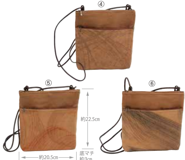
柿渋染 手描き2Fポシェット 2,000円(税抜) (KS-111) ④849000 柿渋柄 ⑤849017 弁柄 ⑥849024 墨柄 約20.5×H22.5×底マチ3cm・(ショルダー)約138cm/重さ約70g/ファスナー開閉 材質:(本体)綿・(ショルダー)アクリル蠟引き/外側:前面ファスナーポケット1