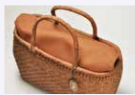
インナー かぶせ使用イメージ