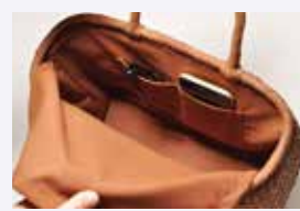
【中国製】柿渋染め調