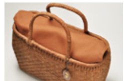
インナー かぶせ使用イメージ