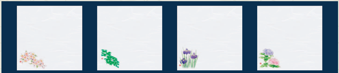
17-292-03 (68805) 桜 (3月～4月)