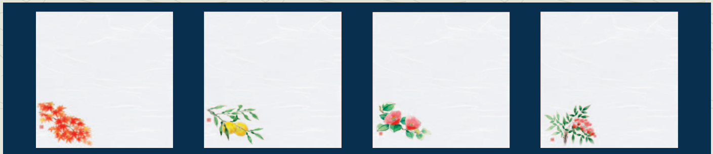
17-292-11 (68823) 赤もみじ (10月～11月)