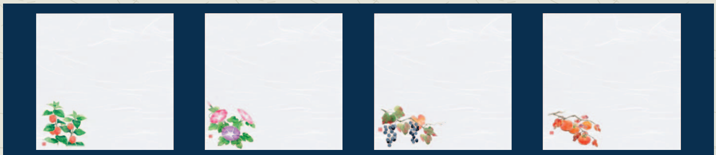
17-292-07 (68819) ほおずき (6月～8月)