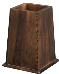
焼杉箸立 17-341-11 (16309) 2,400円 約9.8×9.8×H14.2cm