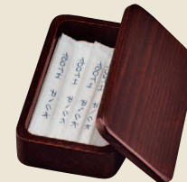
長手楊枝箱 ブラウン 17-341-29 (15298) 2,000円 約11×6.5×H3.2cm 内寸約10×5.3×H2cm ※袋入の楊枝を入れることができます。 (最長10cm)