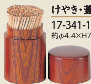
けやき・蓋付楊枝立 17-341-16 (16335) 1,300円 約φ4.4×H7.8cm