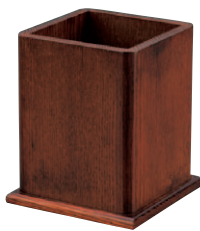
角型ワイド箸立 ハイブラウン 17-341-13 (16109) 2,950円 約9.9×9.9×H13cm