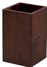
SC 木製カトラリースタンド ブラウン 17-341-07 (15188) 1,800円 約8×8×H13cm