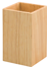
SC 木製カトラリースタンド ナチュラル 17-341-08 (15189) 1,800円 約8×8×H13cm