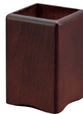
角丸箸立 ブラウン 17-341-09 (15248) 2,400円 約8.8×8.8×H13.4cm