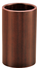
丸型箸立 ハイブラウン 17-341-01 (15102) 2,200円 約φ7.8×H13.1cm