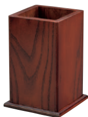
角型箸立 ハイブラウン 17-341-06 (15101) 2,000円 約9×9×H13.2cm