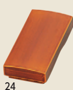
本春度かぶせ楊枝入 17-341-24 (67229) 5,100円 約10.8×5.3×H2.3cm/内寸約9.2×3.7×H1.4cm