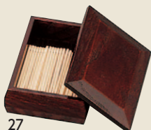
ケヤキ風・楊枝箱 17-341-27 (15117) 1,650円 約9.9×6.6×H3cm/内寸約8.7×5.4×H2cm