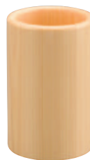
ひのき丸型箸立(小) 17-341-04 (15311) 2,300円 約φ8.2×H13cm