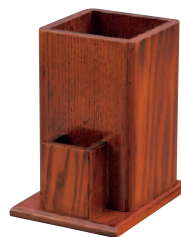
楊枝入付箸立 ハイブラウン 17-341-14 (15198) 3,150円 約9×11.5×H13.7cm 楊枝入約4×2.5×H5cm