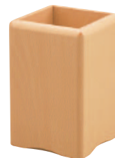
角丸箸立 ナチュラル 17-341-10 (15228) 2,250円 約8.8×8.8×H13.4cm