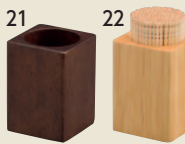
SC 木製ピックスタンド 17-341-21 (15275) ブラウン 650円 約4.3×4.3×H6cm 17-341-22 (15276) ナチュラル 650円 約4.3×4.3×H6cm