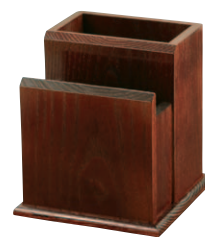
ナブキン&箸立 17-341-15 (15497) 3,550円 約12×12×H13.5cm 箸立内寸約9.2×5cm