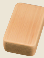
長手楊枝箱 クリアー 17-341-28 (15299) 1,850円 約11×6.5×H3.2cm 内寸約10×5.3×H2cm ※袋入の楊枝を入れることができます。 (最長10cm)