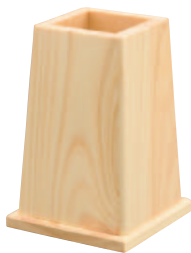
ひのき箸立 17-341-12 (16305) 1,900円 約9.8×9.8×H14.2cm