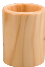
ひのき丸型箸立(大) 17-341-03 (15310) 3,000円 約φ9.5×H12.8cm