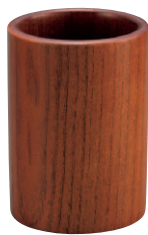
丸型箸立(大) ハイブラウン 17-341-02 (16120) 2,800円 約φ9.5×H13cm