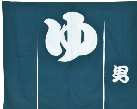
ゆのれん 4連 17-467-07 (51503) 赤(女) 22,850円 17-467-08 (51502) 青(男) 22,850円 約W170×H140cm ※綿100% ※型染め