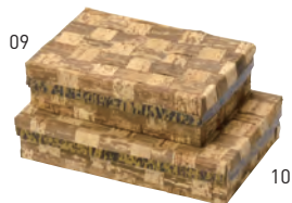
竹皮弁当箱&lt;内側紙貼&gt; 網代

※材質:竹皮+紙(コーティング加工) ※耐水・耐油形状ではありません。 ※高温の食材へのご使用はお避けください。