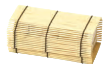
新すだれ弁当 無地ミニ

19-104-01(38637) 340円 約14×7.5×H5.5cm / 内寸約11×7×H5cm