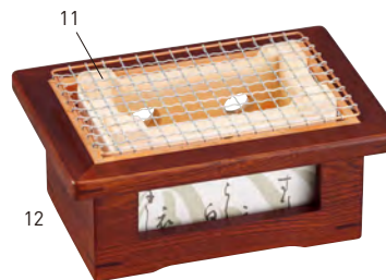
長角飛驒コンロ(小)用金網