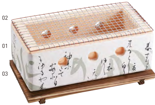
長角飛驒コンロ(大)白