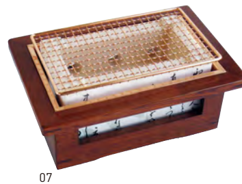
長角飛驒コンロ(中)用木枠

20-063-06(21528) 1,350円 約21.5×12.5×H2.5cm