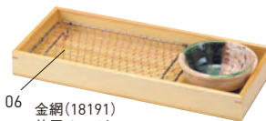
06 金網(18191) 使用イメージ