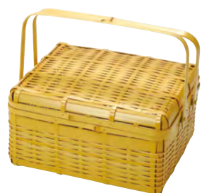
菱木編み竹籠(大・手付)

20-096-03 (22708) 49,000円 約28×22×H15.5(25)cm / 身約H12.8cm