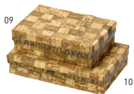
竹皮弁当箱&lt;内側紙貼&gt; 網代

※材質:竹皮+紙(コーティング加工) ※耐水・耐油形状ではありません。 ※高温の食材へのご使用はお避けください。