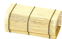
新すだれ弁当 無地ミニ

20-108-01(38637) 380円 約14×7.5×H5.5cm / 内寸約11×7×H5cm