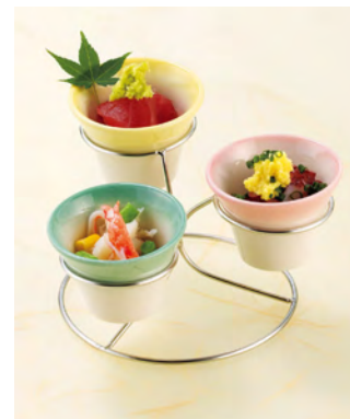
ワイヤリングスタンド