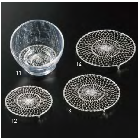
ステンレス手編み目皿