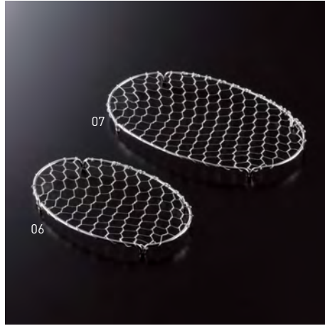
ステンレス小判目皿