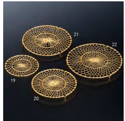
金州(ゴールド仕上)