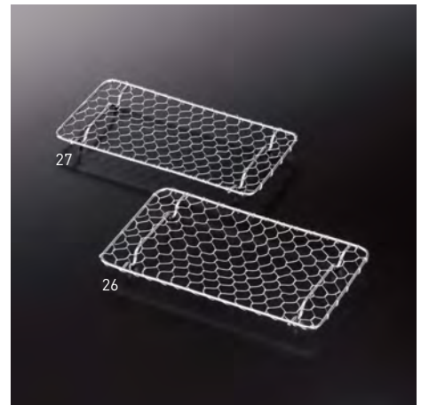
とんかつ用金網 長角(足付)