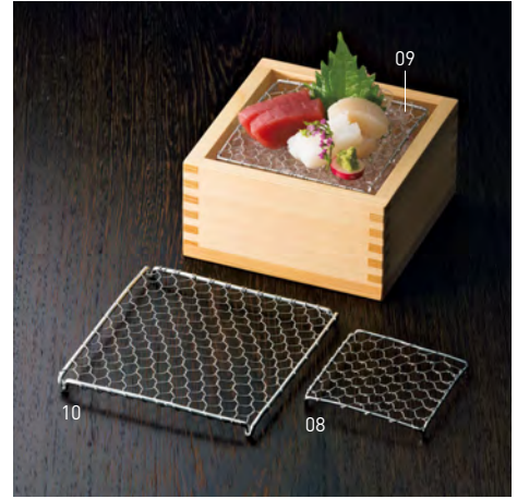
ステンレス目皿 角型