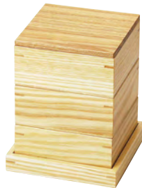
タモ・正角料理箱三段セット(蓋付)

20-139-04 (27892) 正角(小) 2,550円 約12.3×12.3×H2.1cm 内寸約11.1×11.1×H1.3cm 20-139-05 (27893) 長角 4,000円 約34.1×12.5×H2.1cm 内寸約32.7×11.1×H1.3cm