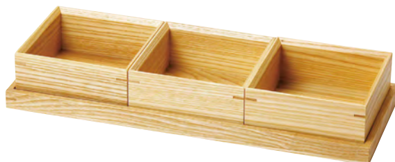
タモ・長角三ツ切セット(蓋なし)

20-139-06 (27895) 12,200円 約12.3×12.3×H14.5cm ※蓋(27891)1点 + 料理箱(27890)3点 + 正角トレイ(小)(27892)1点セット