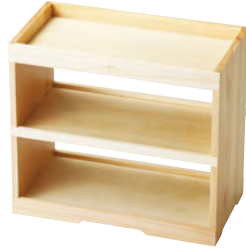
桧・かざり棚弁当

松花堂を縦型に。 スペースを省き、高さを出した演出が可能です。 無駄を省いたシンプルな構造。 背版がないので、対面で両方から取り分けることも可能です。 1人用のお弁当から、アフタヌーンティーのセットまでアイデア次第で使い勝手が広がる器です。