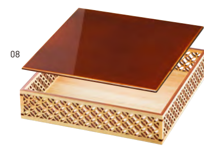
ひのき細密盛器用 春慶印籠蓋 20-163-07(28004) 6,000円 約21×21×H1.8cm ※蓋のみ ※裏木曾春慶塗