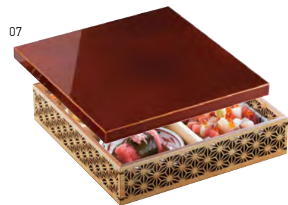
ひのき細密盛器(足付) 七宝 積重 20-163-06(38175) 20,000円 約21×21×H6.5cm / 内寸約20×20×H4cm ※仕切別売