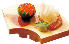
桧・紅節ミニ盛台 扇型(すべり止め付)

20-230-08 (25759) 1,450円 約14.5×9.5×H2.5cm