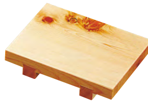
桧ミニ紅節長角盛台(すべり止め付)