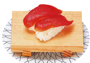
ミニ長角盛台(すべり止め付)