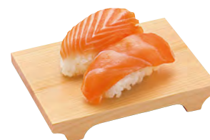
東濃檜・盛皿ミニ