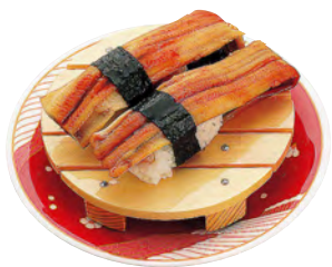
白木寿司皿(B)(すべり止め付)