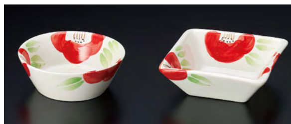
手描き・椿小鉢 丸(大)