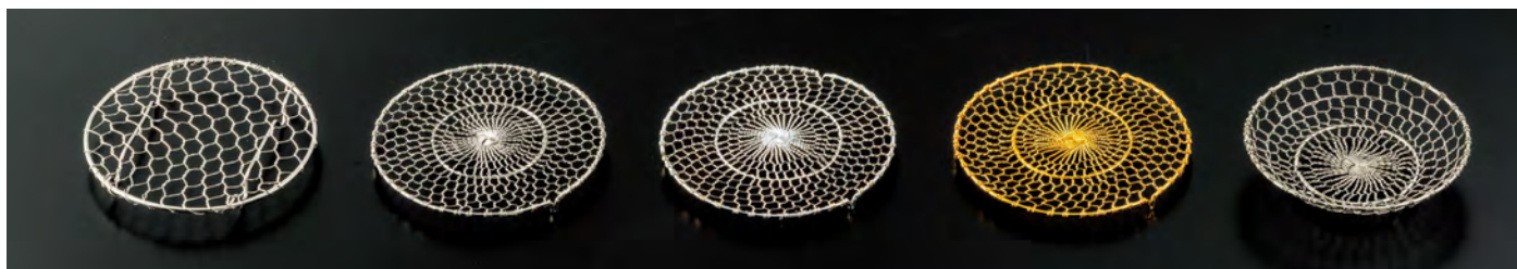
ステンレス目皿 4寸