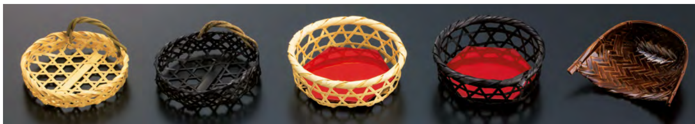
六ツ目がずら付籠

【中子 標準サイズ】 1樹内寸が11.6×11.6cm以上のものにお使いいただけます。