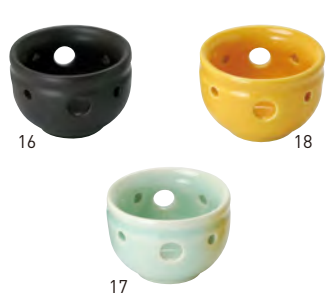
陶器・花の和珍味入