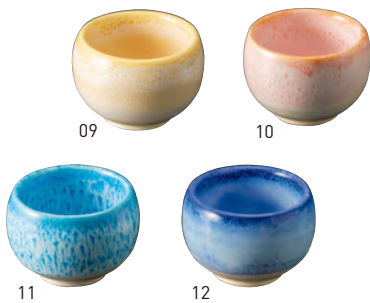
二色吹き丸型珍味入