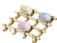
新朝顔棚(女竹)足付