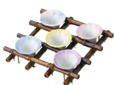
新朝顔棚(黒竹)足付