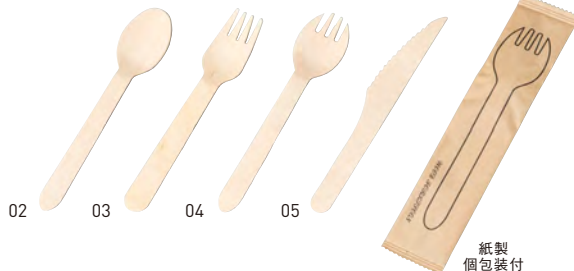
白樺・エコカトラリー(紙完封)(100本入)

20-316-01(08908) 750円 約L14cm (1本当り3.75円)