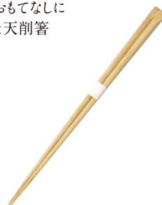
先細竹 天削箸(50膳入)(無塗装)