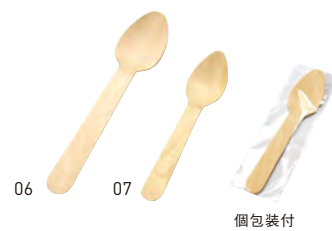
白樺・エコスプーン(完封)(100本入)