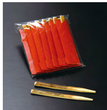
黒文字・祝楊枝(10本入)