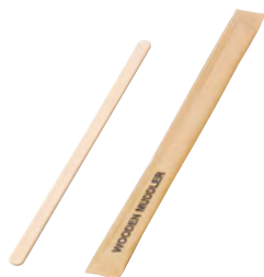
白樺・エコカトラリー(紙完封) マドラー(200本入)

20-316-01(08908) 750円 約L14cm (1本当り3.75円)