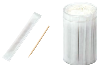
国産白樺爪楊枝(完封)(100本入)