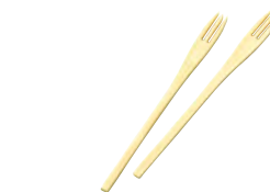
竹・エコフォーク 小(50本入)