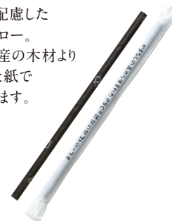
匠の紙ストロー(10本入)

環境に配慮した 紙のストロー。 山梨県産の木材より 作られた紙で できています。