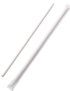
紙のストロー 白(完封)(200本入)