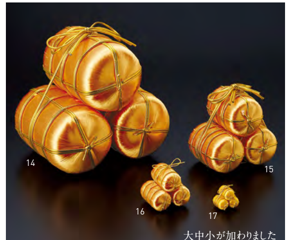
大中小が加わりました