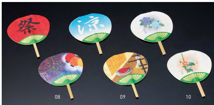
飾りミニうちわ(両面PPラミ) (50枚入)

20-341-08(63104) 祭/花火 4,400円(1枚当り88円) 20-341-09(63105) 涼/風鈴 4,400円(1枚当り88円) 20-341-10(63106) 紫陽花/朝顔 4,400円(1枚当り88円)