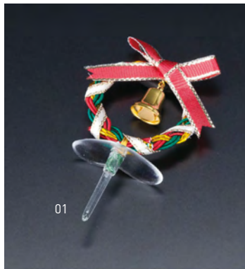
水引クリスマスピック リース(5本入)

20-341-01(25688) 800円 約5×L8cm (1本当り160円)