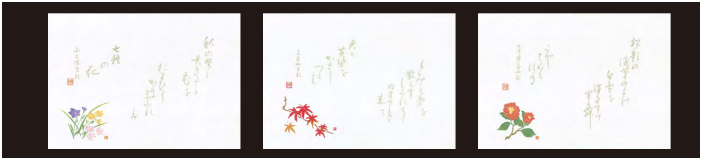
20-350-06 (64533) 秋草(8月~9月)