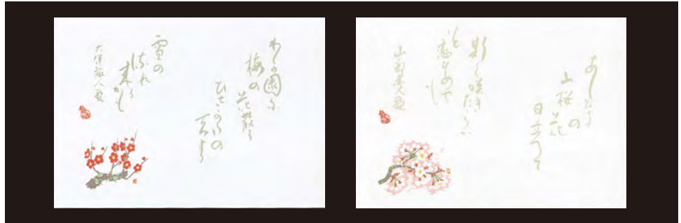
20-350-01 (65063) 梅(1月~3月)