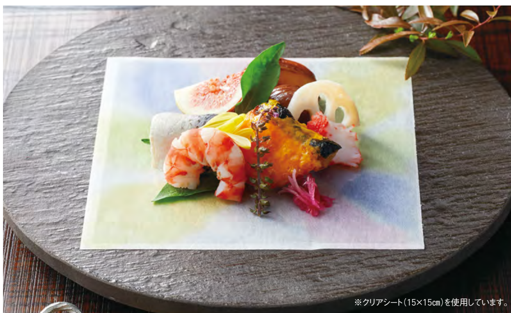
※クリアシート(15×15cm)を使用しています。

ご使用上の注意 食用色素インキを使用しておりませんので、直接お料理を盛りつける時は、必ず印刷部分避けるかOPクリアシートをご使用ください。