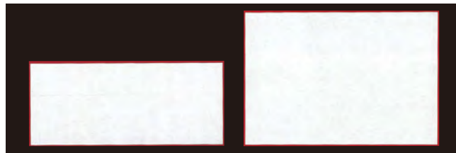
20-375-03(65762) 長角(小) 3,200円 約8.5×19.5cm (1組当り32円)