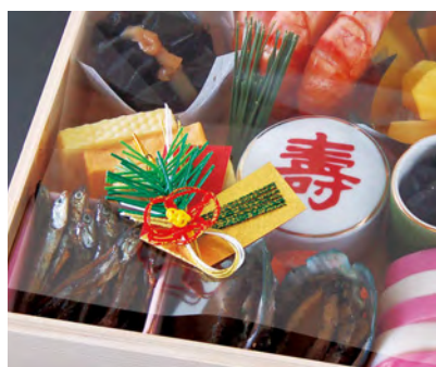
05,06はお節重にも最適です。 05:お節重6.5寸に適合 06:お節重7寸に適合