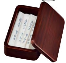
長手楊枝箱 ブラウン

20-431-12(15299) 2,150円 約11×6.5×H3.2cm / 内寸約10×5.3×H2cm ※袋入の楊枝を入れることができます。(最長10cm)