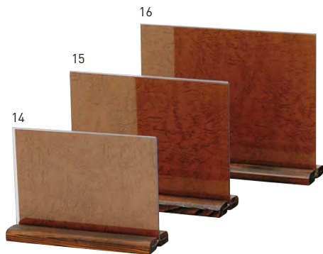
和風メニュー立(焼杉足)

20-431-14(48206) 小 1,700円 約18×H13cm 20-431-15(48207) 中 1,900円 約21×H16cm 20-431-16(48208) 大 2,200円 約24×H19cm