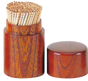
けやき・蓋付楊枝立