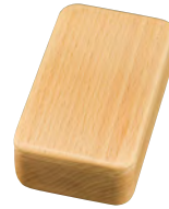
長手楊枝箱 クリアー

20-431-10(16395) 2,500円 約9.5×6×H3cm / 内寸約8.5×5×H1.8cm