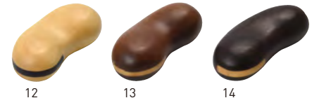
12 13 14