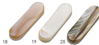
18 19 20