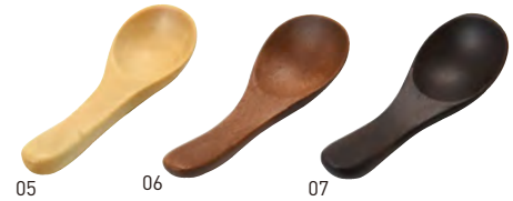
05 06 07