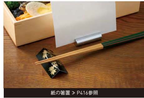
紙の箸置 > P416参照