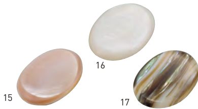
15 16 17