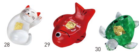
28 29 30